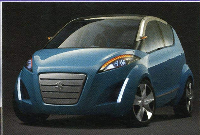
La Splash de Suzuki gardera-t-elle cette calandre gloutonne?

Peugeot et sa 908 RC dont nous avons les photos avant le Mondial ne nous avait pas séduit. Plutôt massive, elle n'anticipait même pas sur la voiture de sport qui prendra part aux prochaines