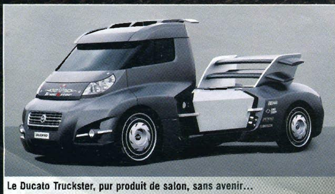
Le Ducato Truckster, pur produit de salon, sans avenir...